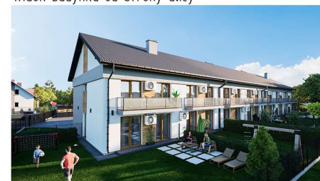
Widok budynku od strony ogródków