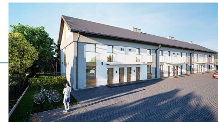
Widok budynku od strony ulicy